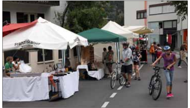
Die Radfahrer prägen auch auf der Genussmeile das Bild

Allen Irrungen und Wirrungen im Tourismusverein sind Trotz wurde auch die 2. Genussmeile durchgezogen. Sie nahm einen hoffnungsvollen Anfang am Freitag und wurde durch das inzwischen schon fast traditionelle Schlechtwetter zu den Mittsommertagen am Samstag gestört und unterbrochen. Daher der Seufzer einer Bürgerin als Titel. Trotzdem sollte sich die Dorfgemeinschaft - nicht nur der Tourismusverein - überlegen, ob man nicht doch eine echte Genussmeile ausrichten sollte, so mit Äpfelkiachl Backen, Fisch Grillen, mit mehr Kaffee- und Kuchen-Kultur, damit die ausgezeichneten und teuren Musiker wissen, warum sie in Latsch auftreten dürfen.