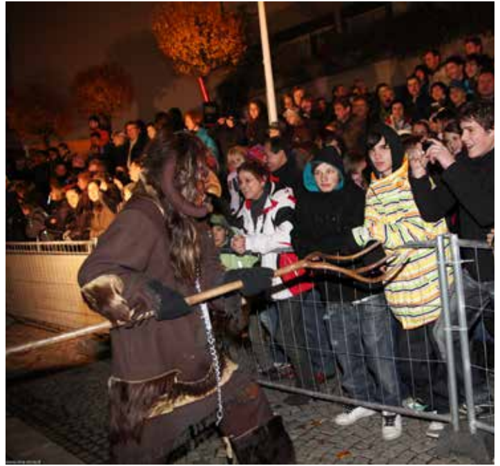
Die Organisatoren möchten mit dieser Großveranstaltung auch in diesem Jahr wieder für Furore sorgen