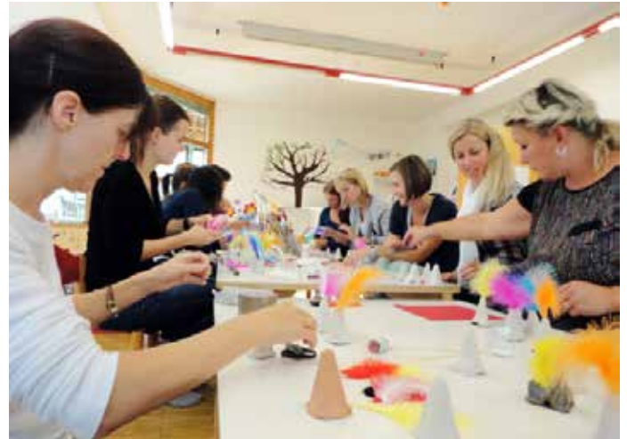
Tagesmütter bei einer Weiterbildung zum Thema Spielmaterialien

„Tagesmutter“ - was ist das eigentlich? Eine Mutter für tagüber, für die Zeit in der die „richtige“ Mutter nicht da ist? Auch der Begriff „Tagespflege“ kann unterschiedliche Vorstellungen wecken: bedeutet das, dass die Kinder dort gepflegt werden, also vor allem ernährt und gewickelt? Was die Tagesmutter den Kleinkindern bietet,