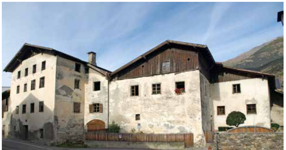
Ein weiteres Beispiel von zum Teil ungenutzter alter Bausubstanz im Dorf.