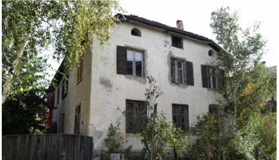
Ein leer stehendes Haus als Beispiel für ungenutzte, alte Bausubstanz.

kann“, erklärt Mantinger und verweist unter anderem auf den „Bärenstadl“ in Laas, der als Parkplatz genutzt wird.