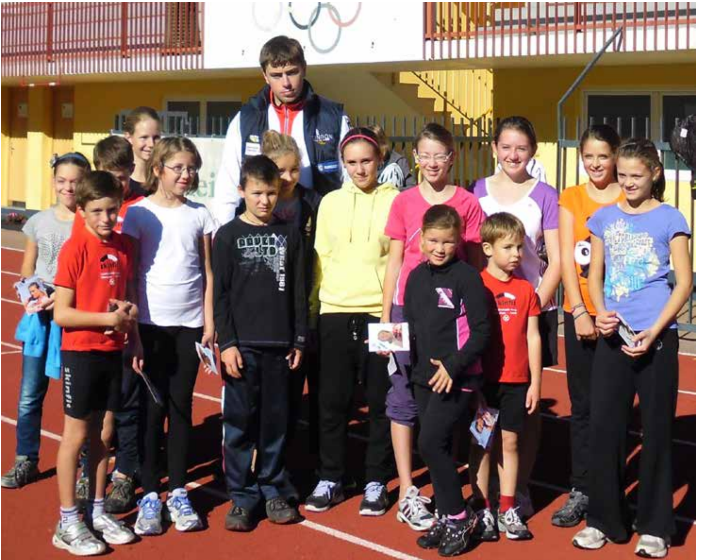
Der Silbermedaillengewinner mit einigen Kindern, die ihr Leichtathletik-Training in Latsch absolvieren.

David Storl holte sich 2011 als erster Deutscher den Weltmeistertitel im Kugelstoßen. Bei den olympischen Spielen im vergangenen Sommer in London verpasste der 22-jährige die Goldmedaille nur knapp. Lange hatte er geführt, doch am Ende warf der Pole Tomasz Majewski drei Zentimeter weiter als Storl. Dennoch überwog beim Deutschen die Freude über die gewonnene Silbermedaille. Es war dies die erste deutsche olympische Medaille im Kugelstoßen seit 24 Jahren. Zudem markierte Storl mit 21,86 Metern seine persönliche Bestleistung.