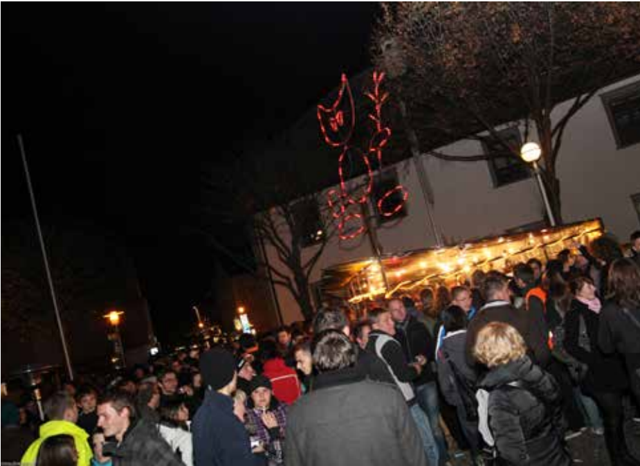
Die vielen Stände rund um den Lacusplatz sorgen auch nach dem Schaulauf für reichlich Unterhaltung

puslauf. Das Dorfzentrum bleibt während der Veranstaltung für den gesamten Verkehr gesperrt. Die Anreise mit dem Vin-schgerzug ist daher eine gute Alternative, um mühelos direkt ins Dorfzentrum zu gelangen“, so das OK-Team der Latscher Tuifl gegenüber dem InfoForum.