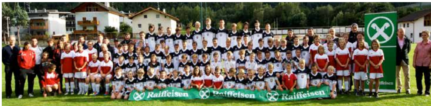
Sportler, Verantwortliche, Trainer und Betreuer beim Gruppenfoto mit den Sponsoren Raiffeisen und Gemeinde Latsch