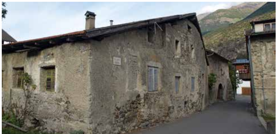
Der vordere Teil dieser alten Bausubstanz ist leer stehend, während der hintere Teil genutzt wird.